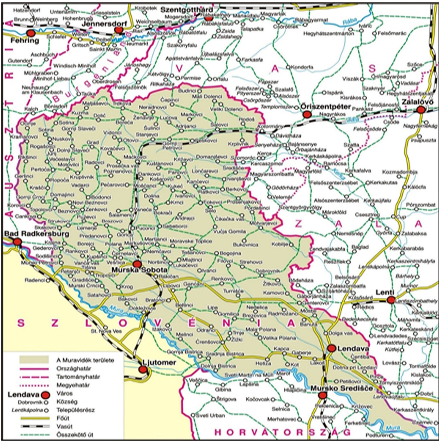
2. ábra: A Muravidék napjainkban