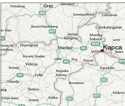
3. ábra: Kapca mint kétnyelvű település Szlovénia térképén

1941-ben a Mura-mentét a magyar hadsereg visszafoglalta, 1945-ig ismét Magyarország része volt, majd a második világháború befejezése után végleg jugoszláv kézbe került. 1991 óta a független Szlovén Köztársaság része.