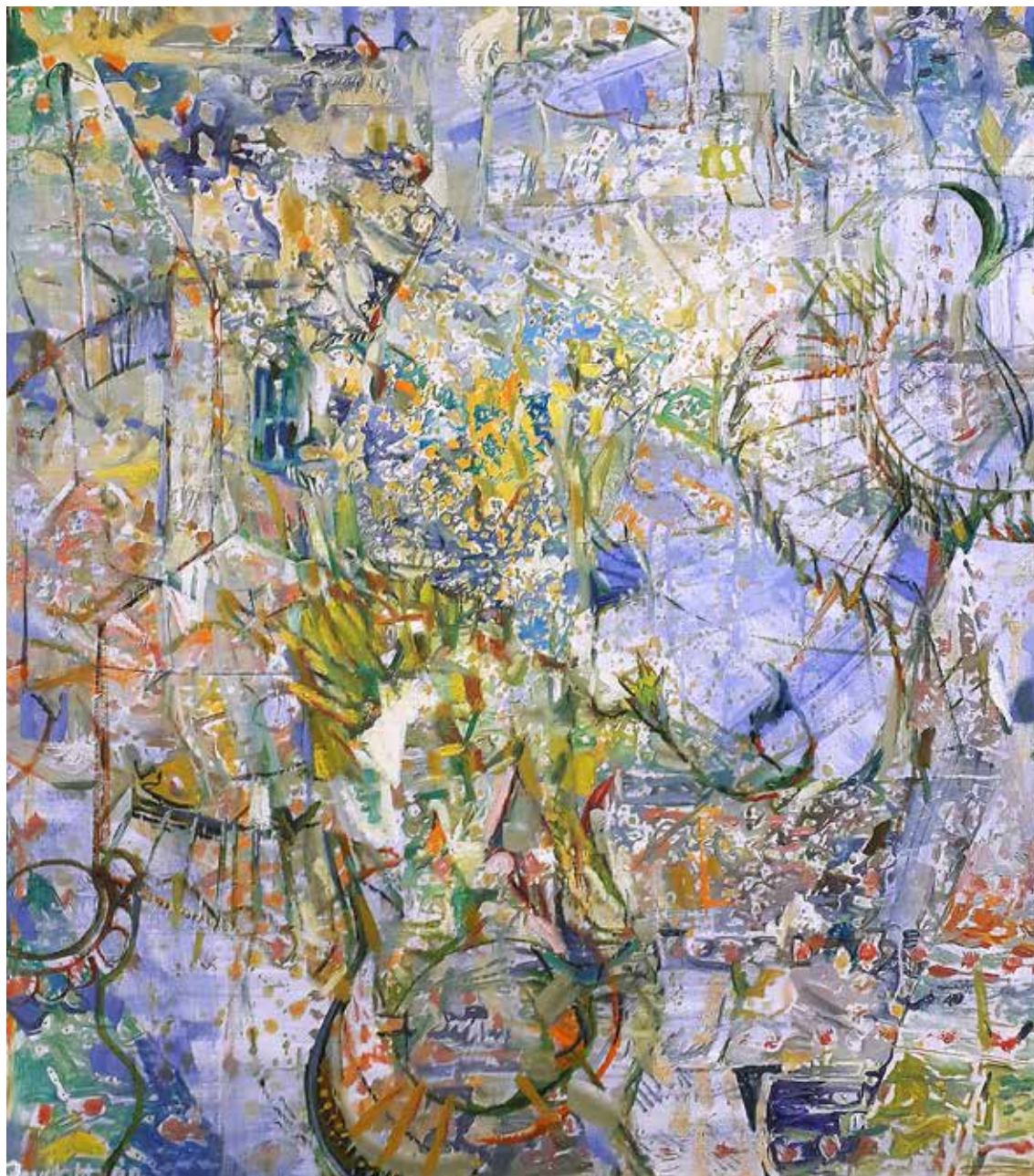
Műteremudvar / Ateliershof

2019 olaj, vászon / Öl auf Leinwand 110 × 90 cm