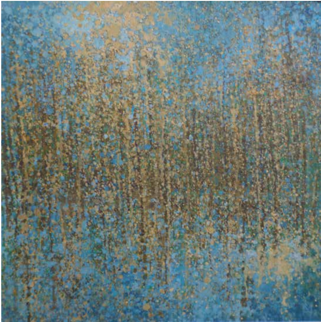
Fénycseppek / Lichttropfen

2020 akril, falemez / Acryl auf Holzfaserplatte 50 × 48 cm