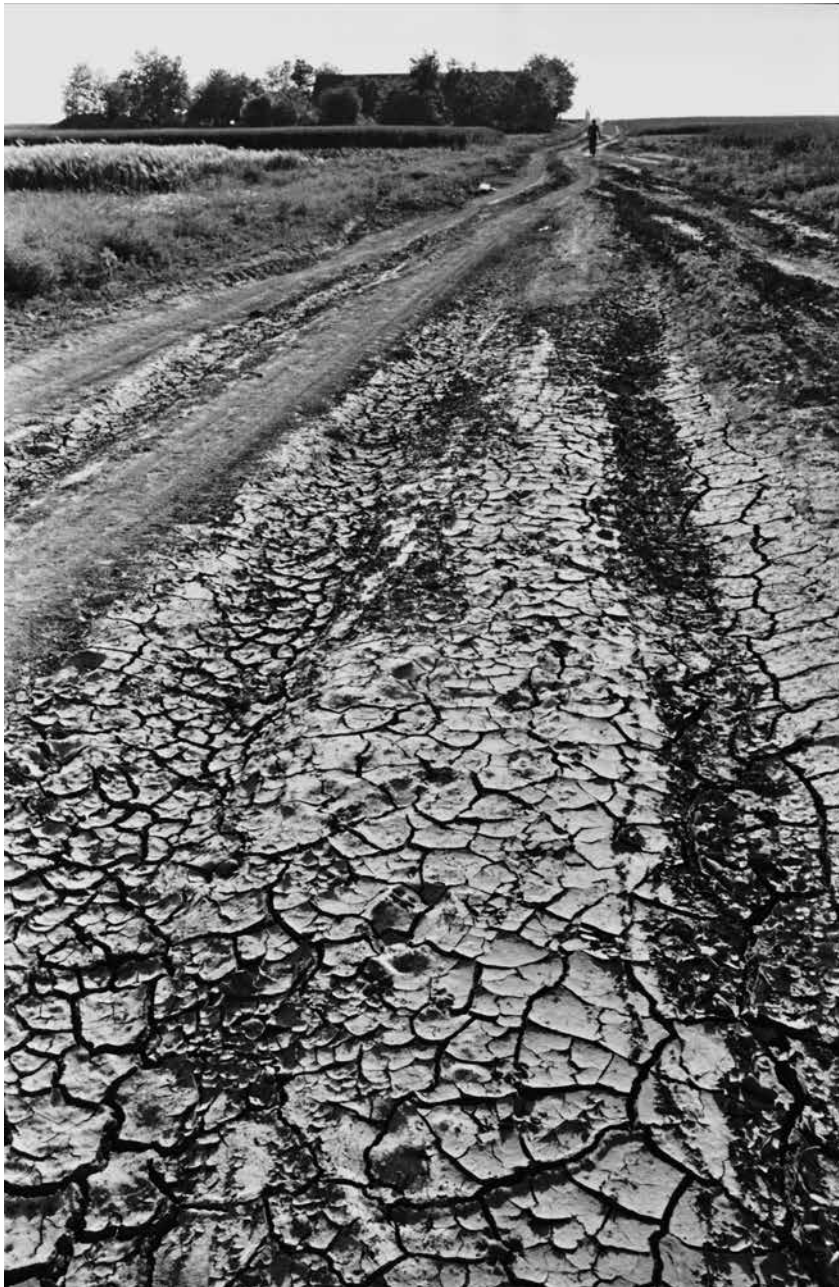
Valkai sor Ada határában / Welt der Einzelgehöfte um die Stadt Ada 1974 fotó, papír / Photo auf Papier 30 × 20 cm