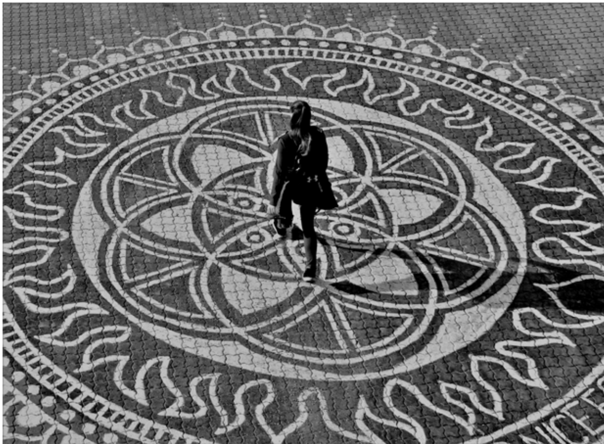
A kör közepén / In der Mitte des Kreises 2019 fotó, papír / Photo auf Papier 40 × 29 cm