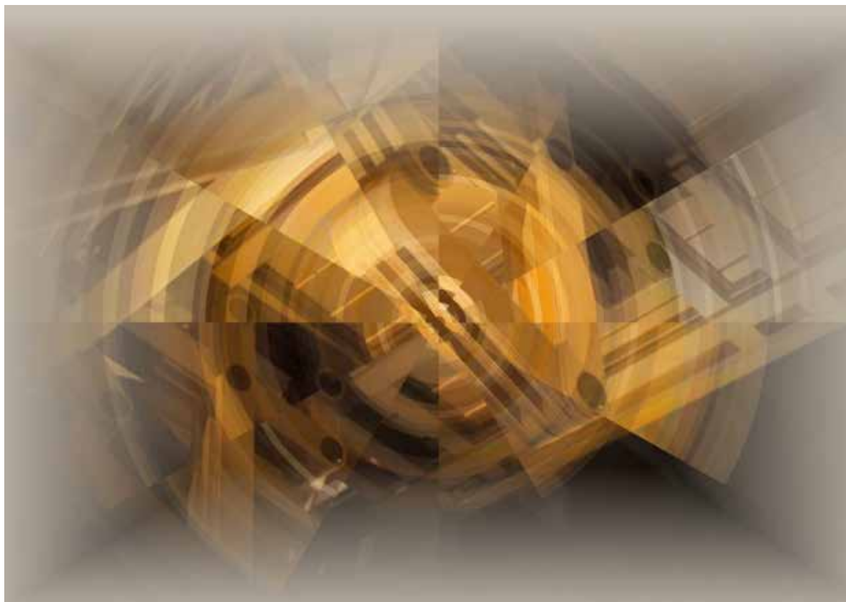
Fények és árnyalatok / Lichter und Abtönungen 2015 elektrográfia, papír / Computergrafik auf Papier 70 × 100 cm