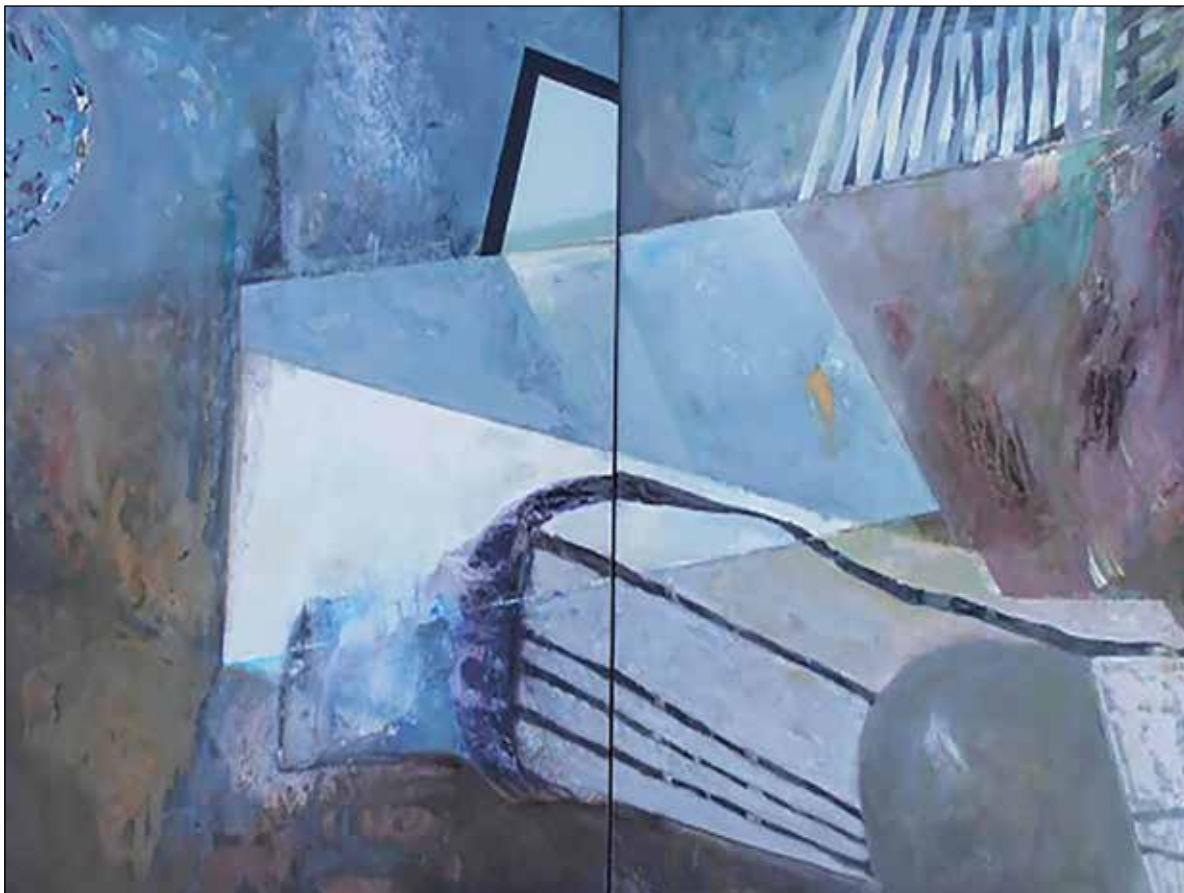
Fények, árnyékok / Lichter und Schatten 2012 akril, vászon / Acryl auf Leinwand 80 × 100 cm