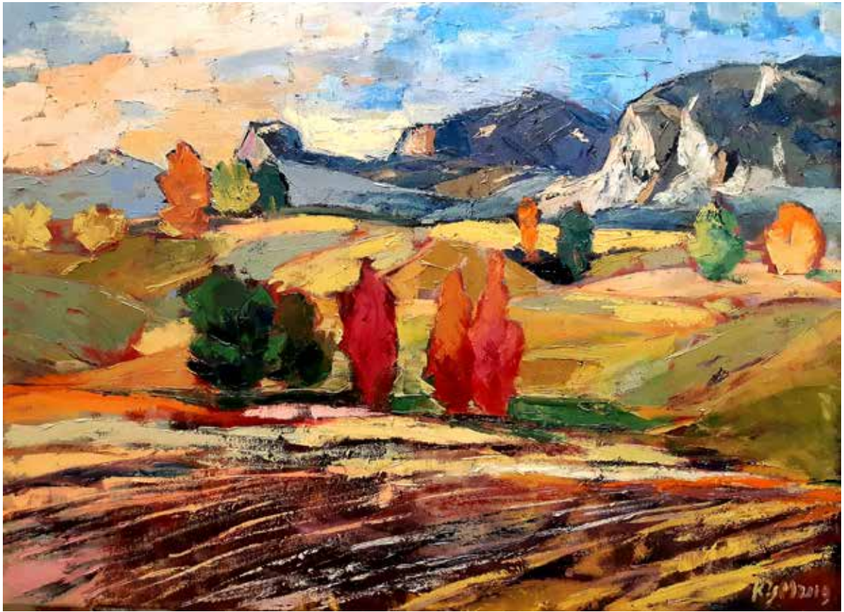
Szines csend / Bunte Stille 2019 olaj, vászon / Öl auf Leinwand 50 × 70 cm