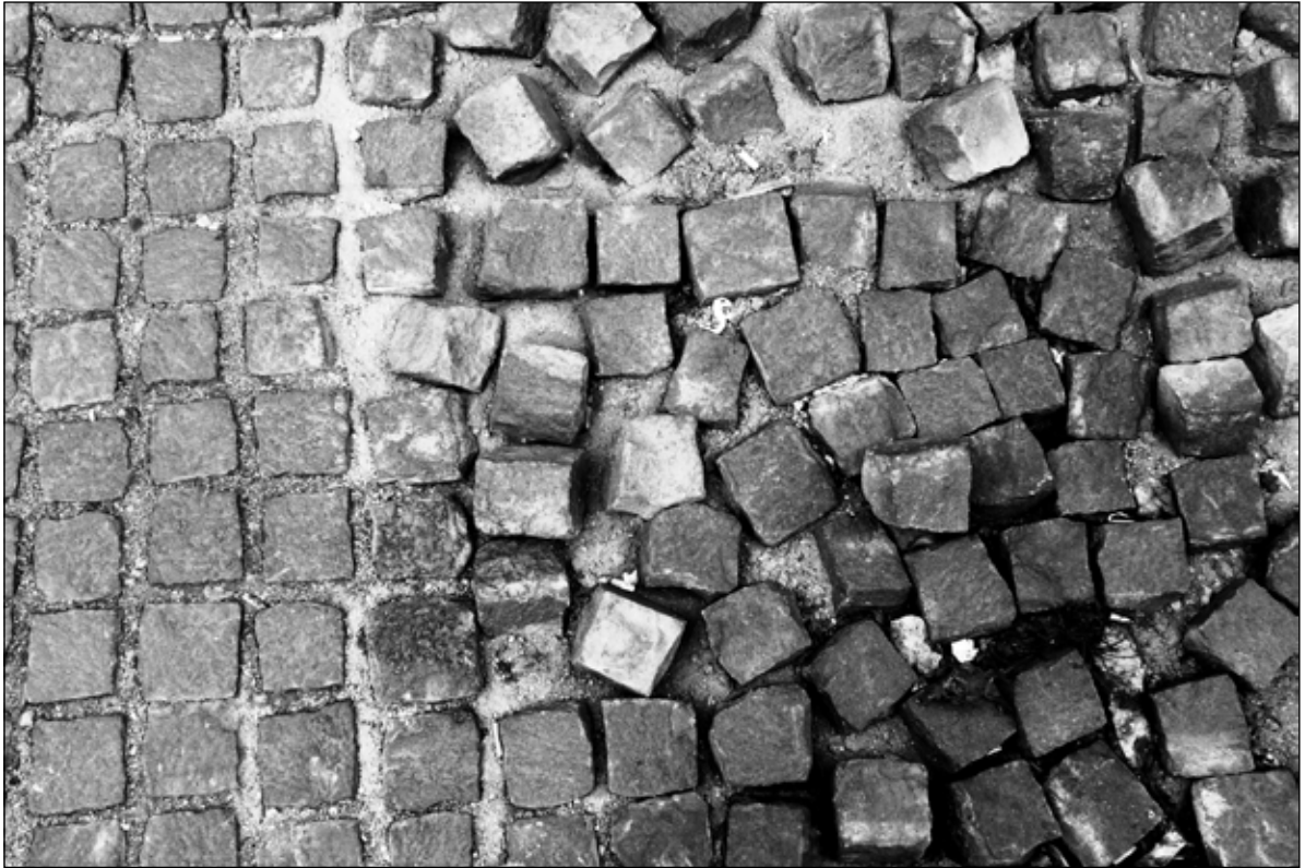
Formabontás / Formbrechung 2013 fotó, papír / Photo auf Papier 50 × 70 cm