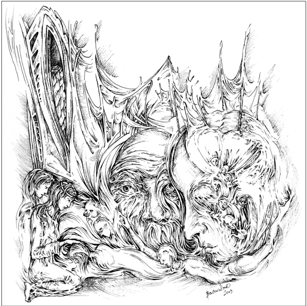
Rege / Sage 2003 tus, papír / Tusche auf Papier 29 × 29 cm