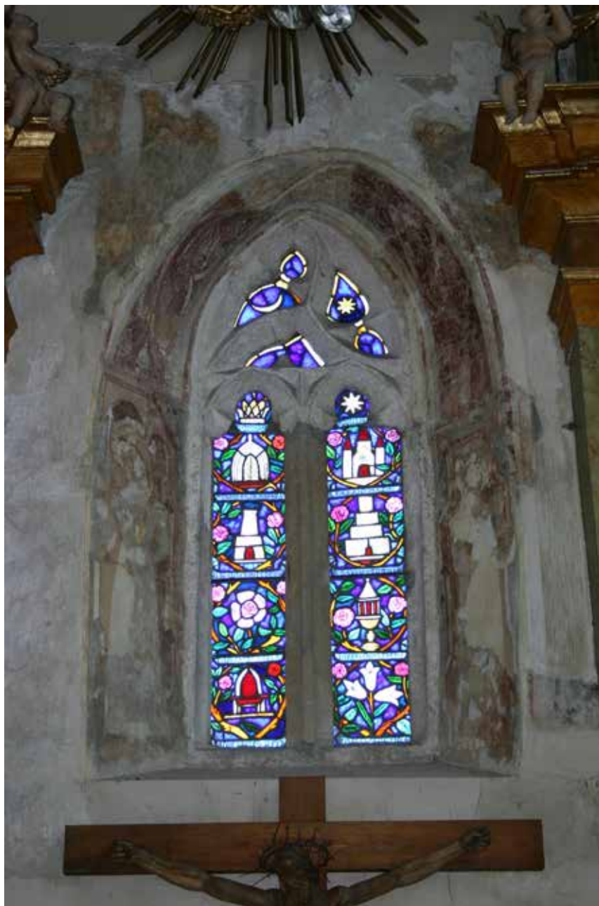
Tereskei római katolikus templom / Römisch-katolische Kirche in Tereske 2005 fotó, papír / Photo auf Papier 47 × 31 cm