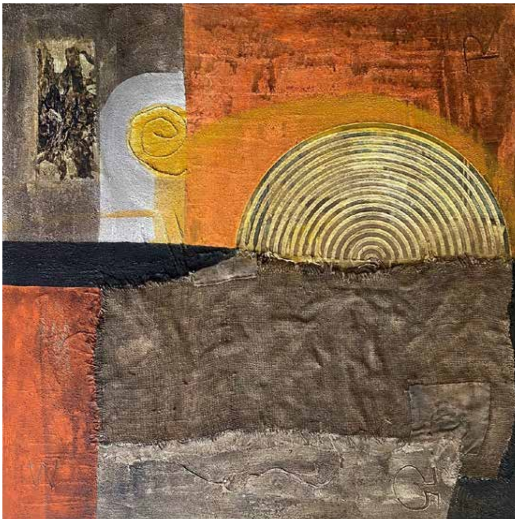
Harmadnapon / Am dritten Tag 2021 vegyes technika, vászon / Mischtechnik auf Leinwand 100 × 100 cm