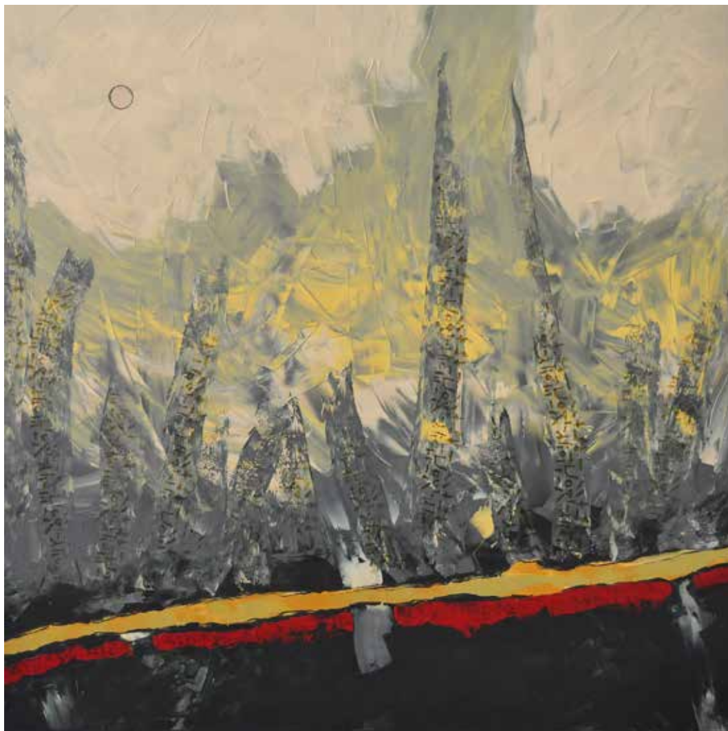
Az ég felé / In Richtung Himmel 2020 akril, vászon / Acryl auf Leinwand 100 × 100 cm