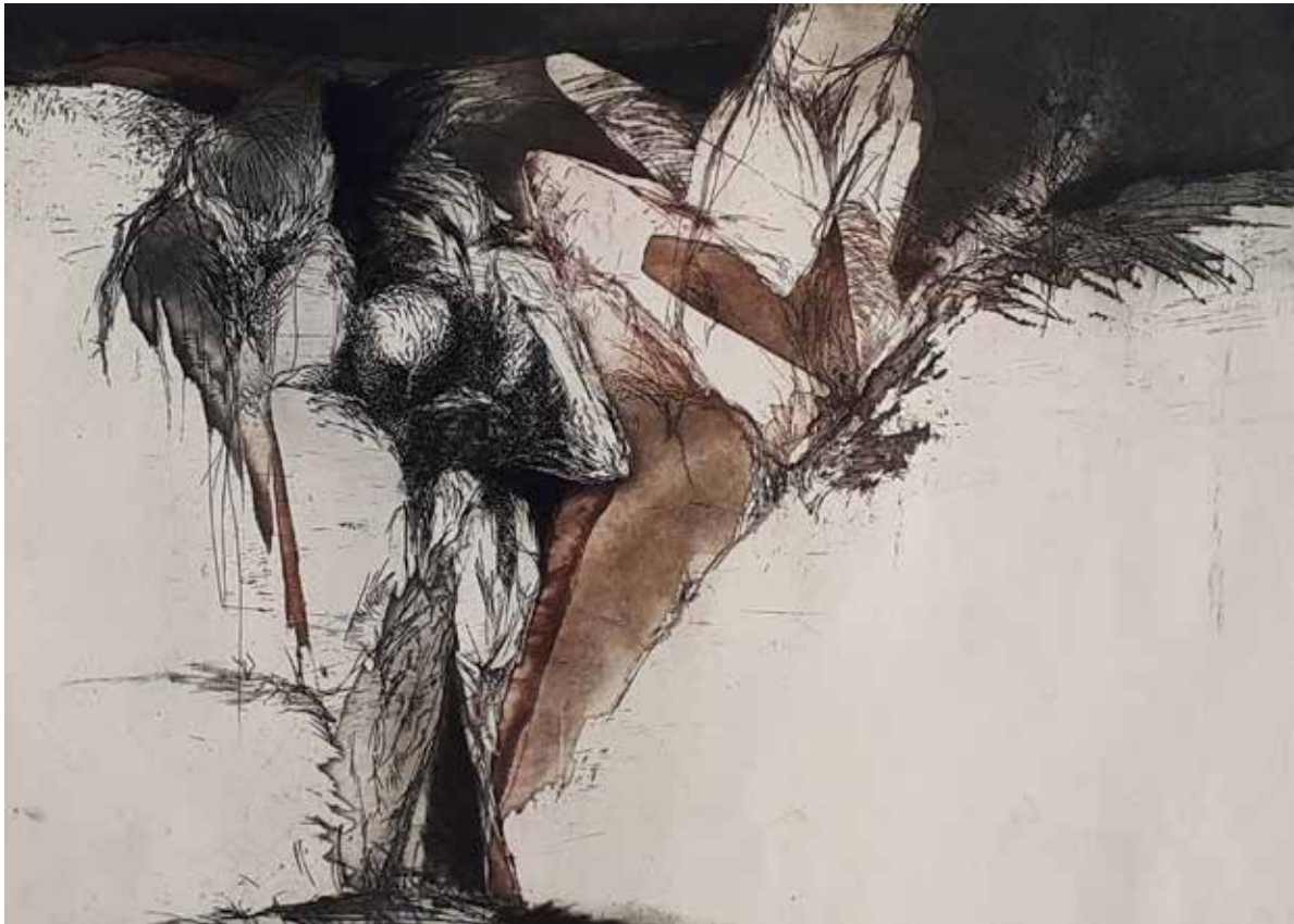
Barbár istenek találkozója / Treffen barbarischer Götter 1994 rézkarc, papír / Radierung auf Papier 30 × 42 cm