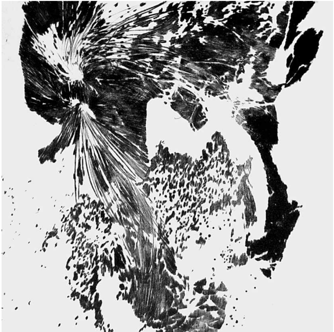
Hiányos megfeleltetések / Mangelhafte Zuordnungen 2014 hidegtű, papír / Kaltnadel auf Papier 60 × 60 cm