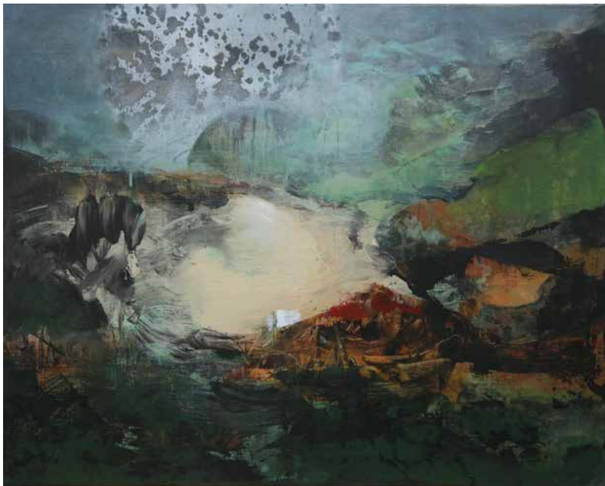
Kozmikus táj / Kosmischer Raum 2019 akril, vászon / Acryl auf Leinwand 60 x 80 cm