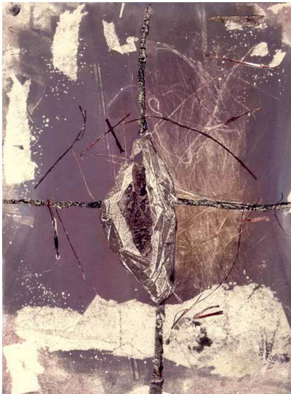
Ágas fészek / Zweignest

1990 monotípiá, papír / Monotypie auf Papier 30 × 20 cm