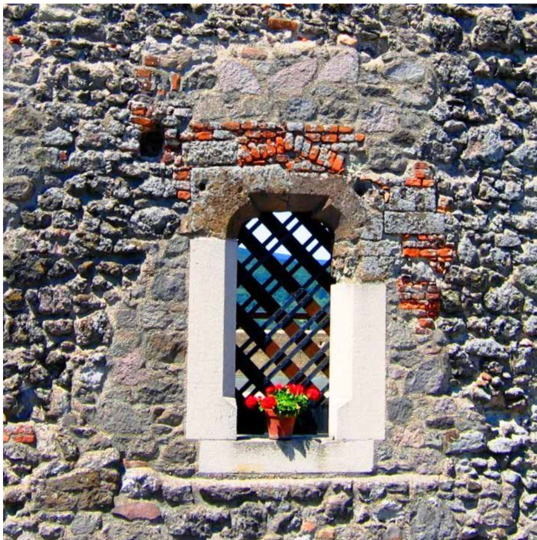
Visegrád / Plintenburg 2018 fotógrafika, papír / Fotografik auf Papier 20 × 20 cm