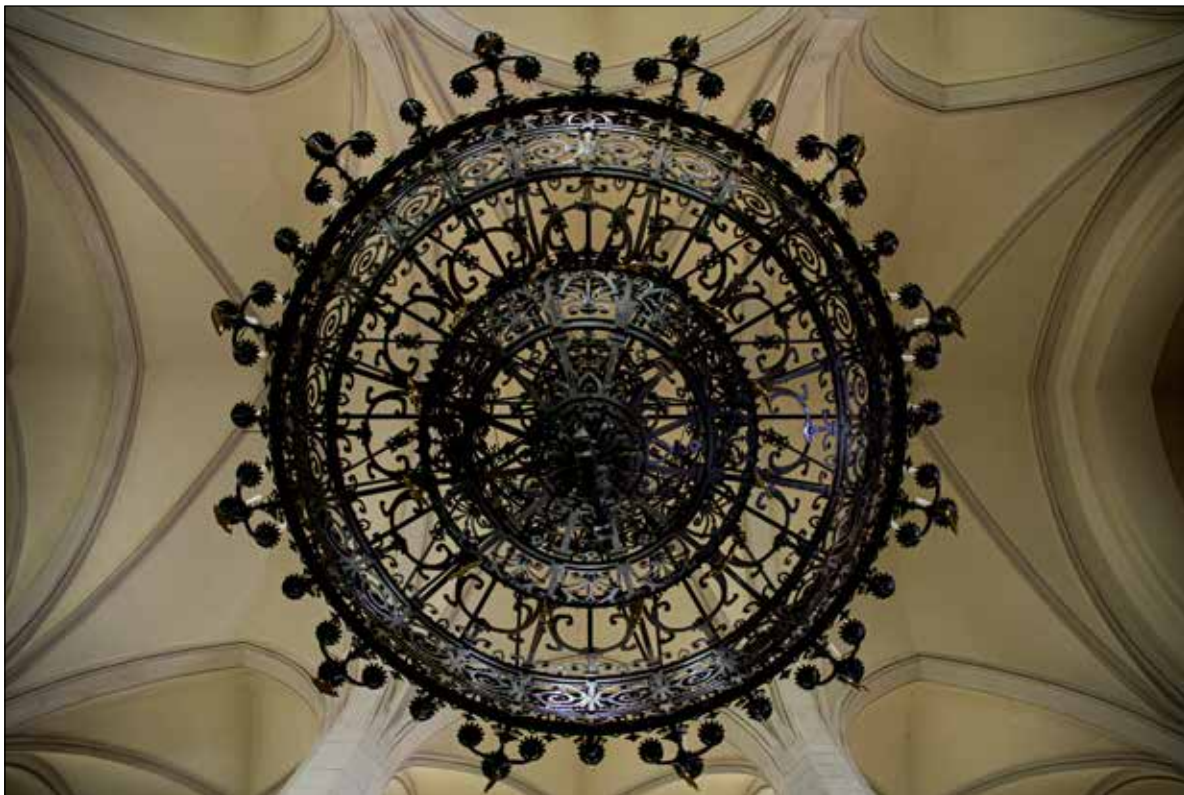
Szimmetria / Symmetrie 2022 fotó, papír / Photo auf Papier 31 × 47 cm