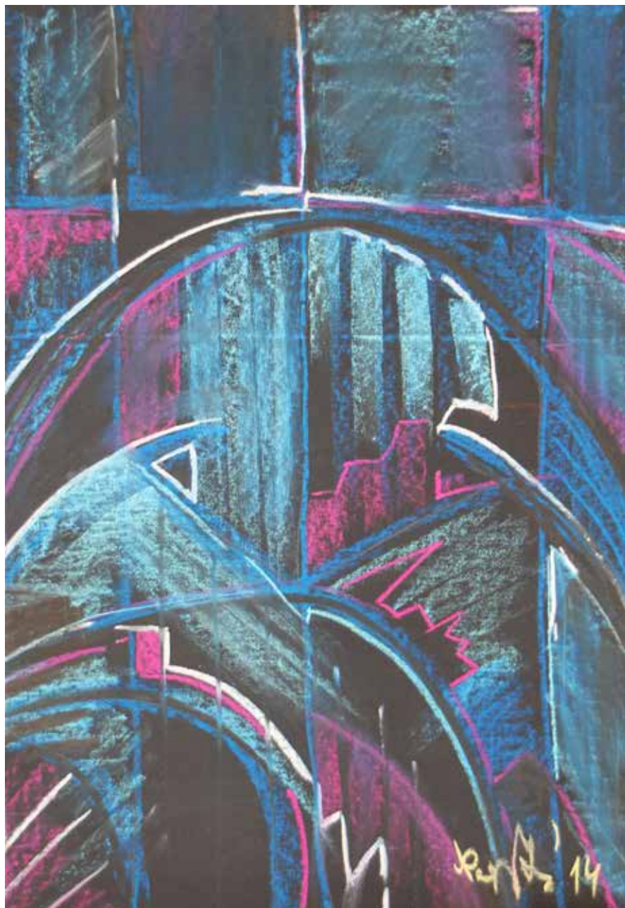
Templomablak / Kirchenfenster

2014 pasztell, papír / Pastell auf Papier 50 × 35 cm