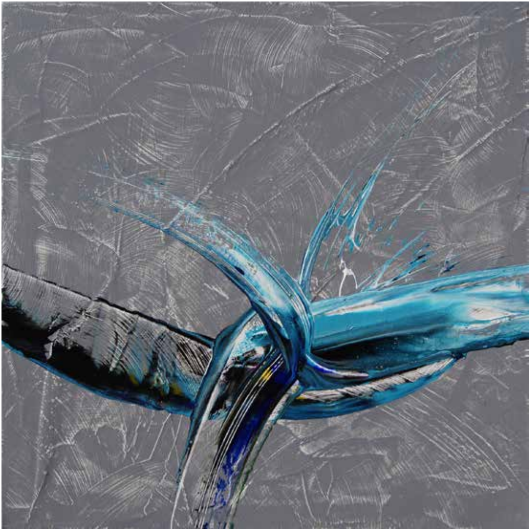
Folyót a tengerbe... / Fluss ins Meer

2019 vegyes technika, vászon / Mischtechnik auf Leinwand 60 × 60 cm