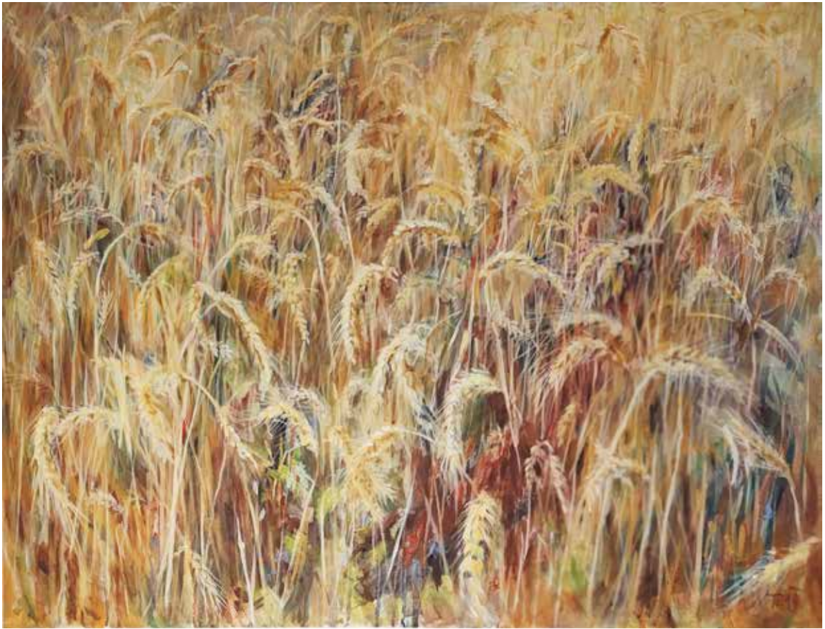
Látótér / Blickfeld

2019 olaj, vászon / Öl auf Leinwand 60 × 80 cm