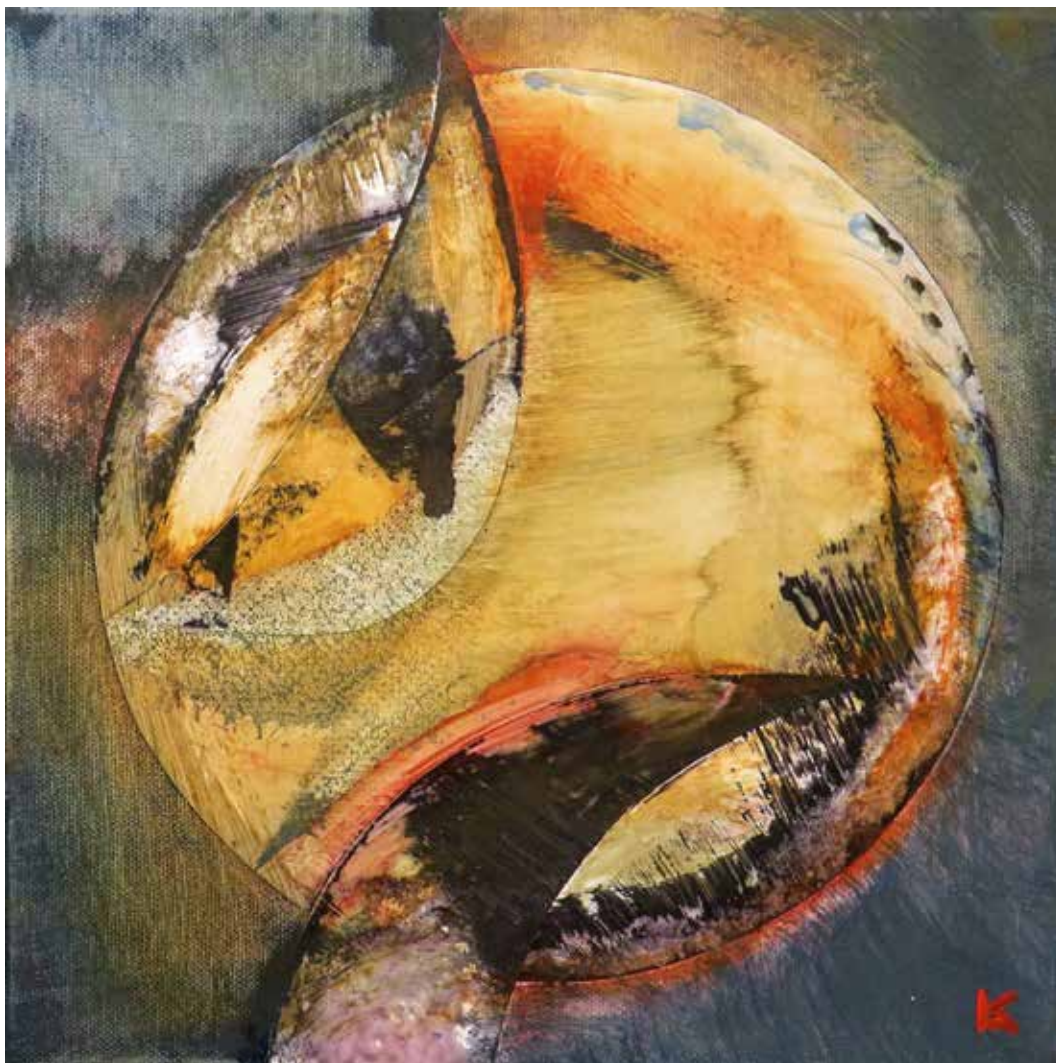
Minden nap más / Jeder Tag ist anders 2020 akril, vászon / Acryl auf Leinwand 30 × 30 cm