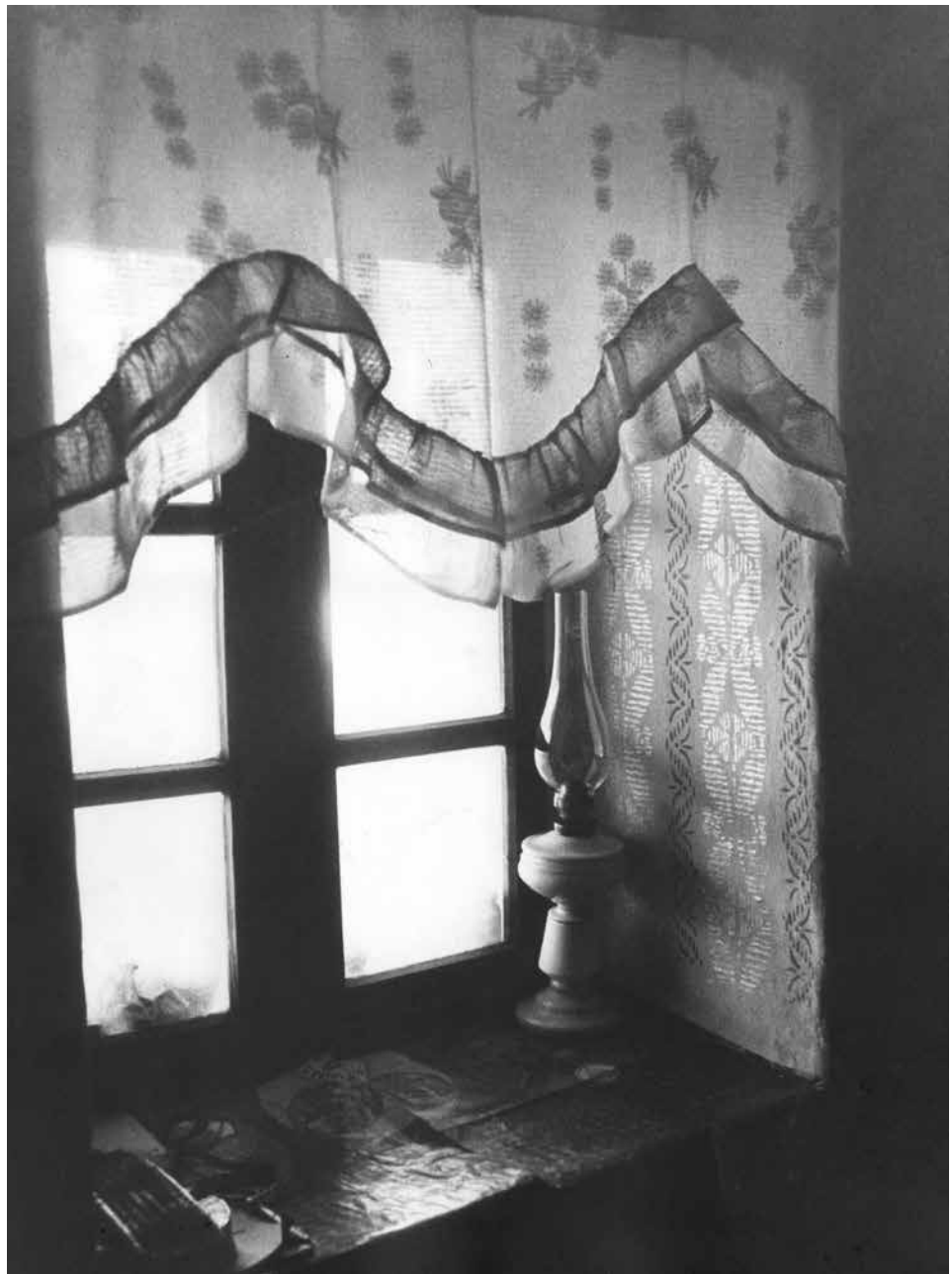
Ablak 1 / Fenster 1

1974 fotó, papír / Photo auf Papier 40 × 30 cm