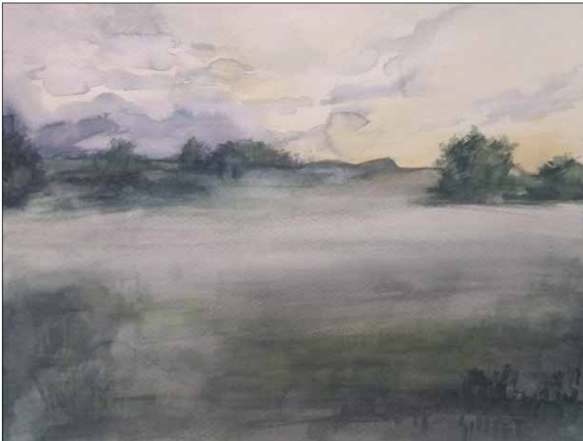
Pára / Dunst 2020 akvarell, papír / Aquarell auf Papier 24 × 32 cm