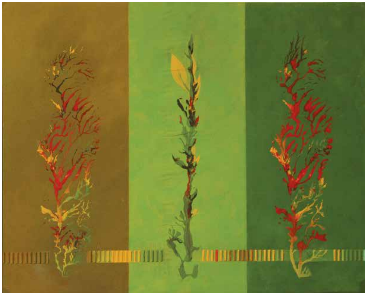
Klónozás / Klonung

1998 akril, vászon / Acryl auf Leinwand 80 × 100 cm