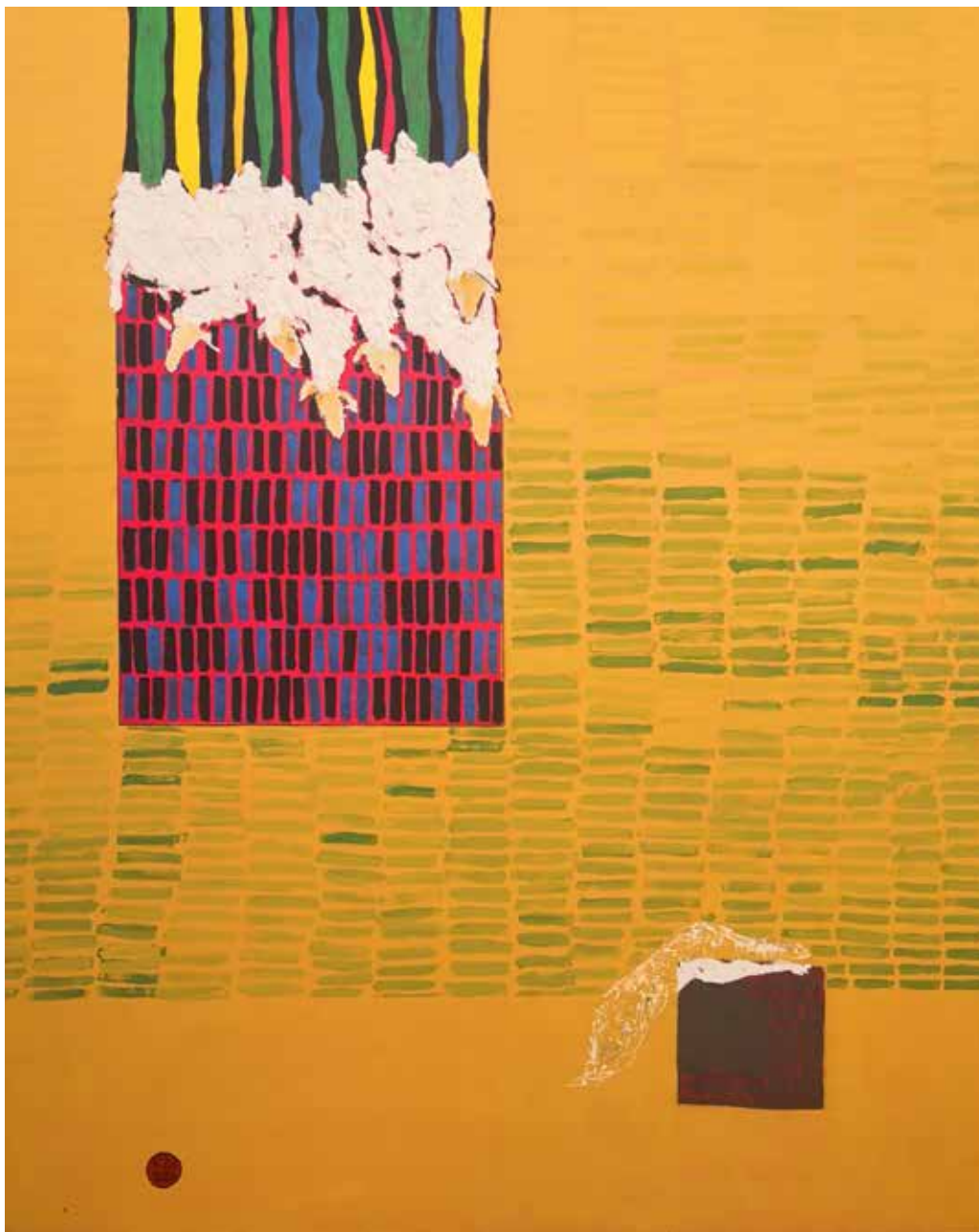
Báránfelhő / Lämmerwolke

2020 akril, vászon / Acryl auf Leinwand 100 × 80 cm