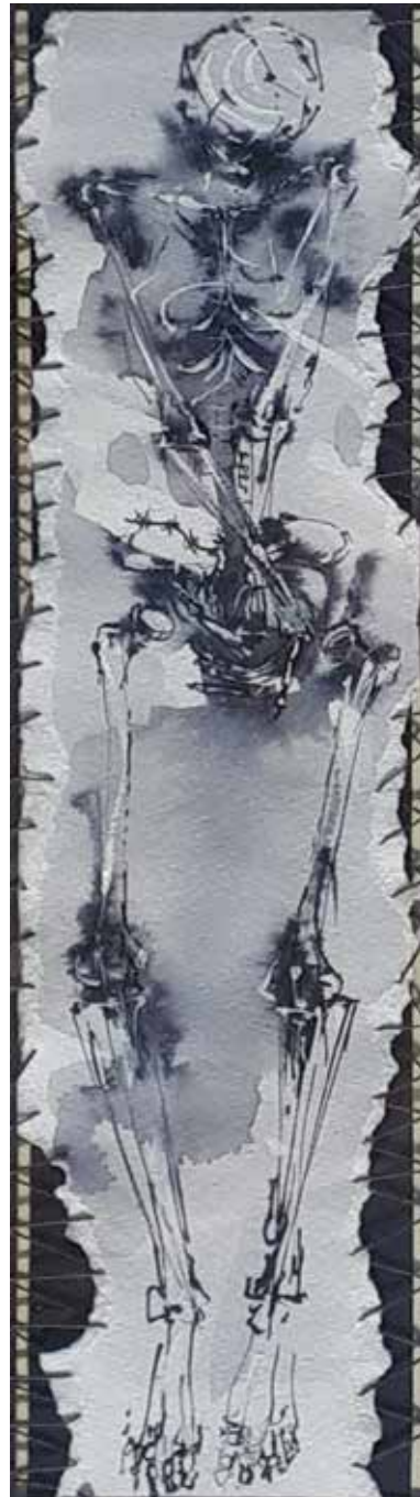
Fosszília / Fossil

1999 vegyes technika, papír / Mischtechnik auf Papier 33 × 8 cm