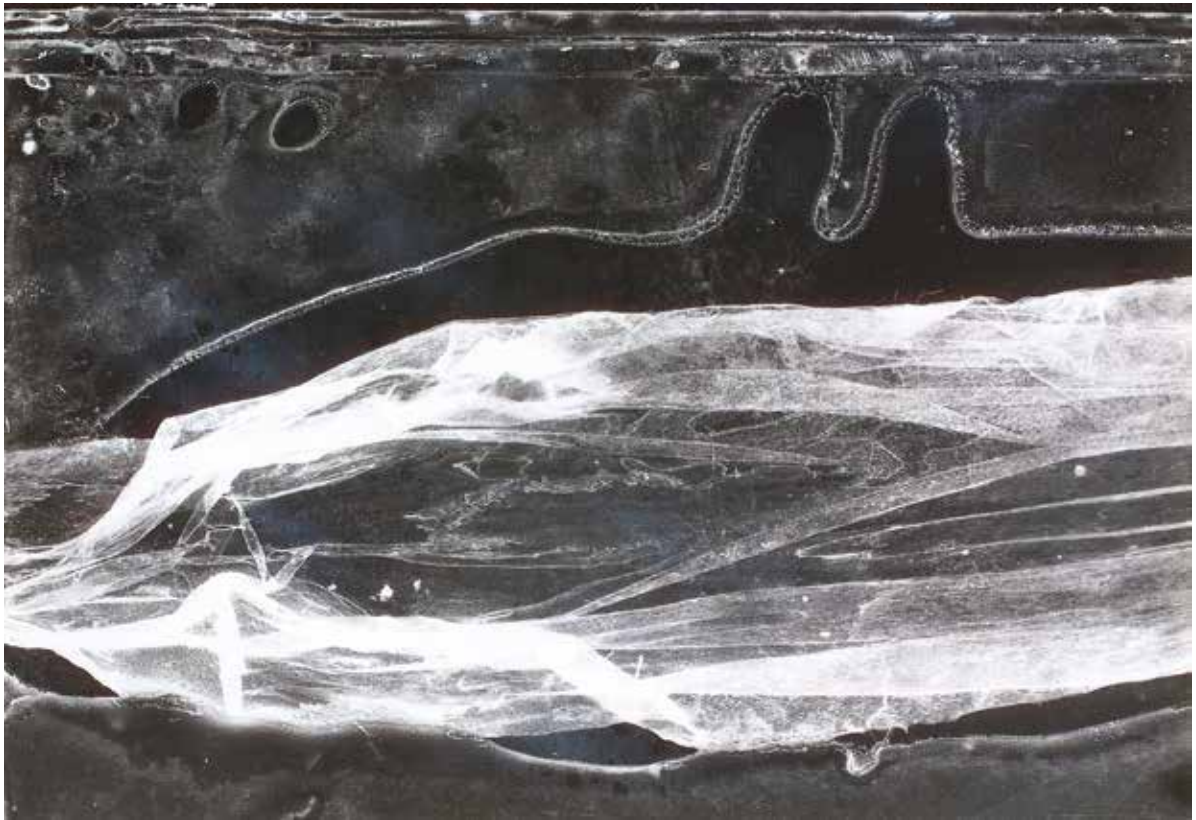
Fotogram 280 / Fotogramm 280 1997 Fotogram / Fotogramm 52 × 61 cm